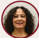
Handan Erbey Kuş Öğretmen İlkokul ÇÖKE Üyesi