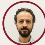
Can Yasa Öğretmen Ortaokul ÇÖKE Üyesi