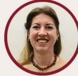
Tuba Akarlı Öğretmen Ortaokul ÇÖKE Üyesi