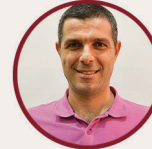
Gökler Avcı Lise Md.Yrd Lise ÇÖKE Lideri