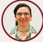
Banu Aldemir İlkokul Md.Yrd ÇÖKE Lideri