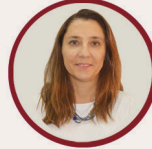
Nihan Şehsuvaroğlu Ortaokul Md.Yrd Ortaokul ÇÖKE Lideri